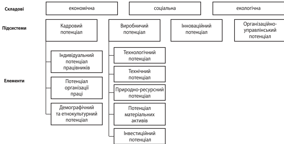
Рис. 1. Структура економічного потенціалу підприємства