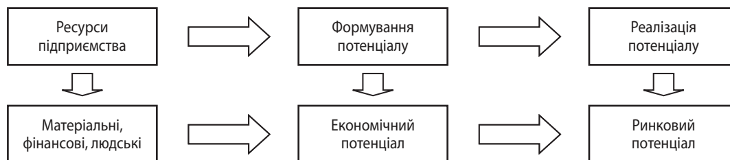
Рис. 2. Концептуальний підхід до поняття «потенціал підприємства» за Р. Алієвим

Інтелектуальний потенціал, своєю чергою, містить: накопичений обсяг знань, інтелектуальний рівень працівників, досвід інноваційної діяльності, сукупність інтелектуальних здібностей працівників (знань, умінь, навиків, інформації, ідей, проектів, цінностей, благ і т. д.) і можливостей щодо їх розвитку, розкриття і використання [15].