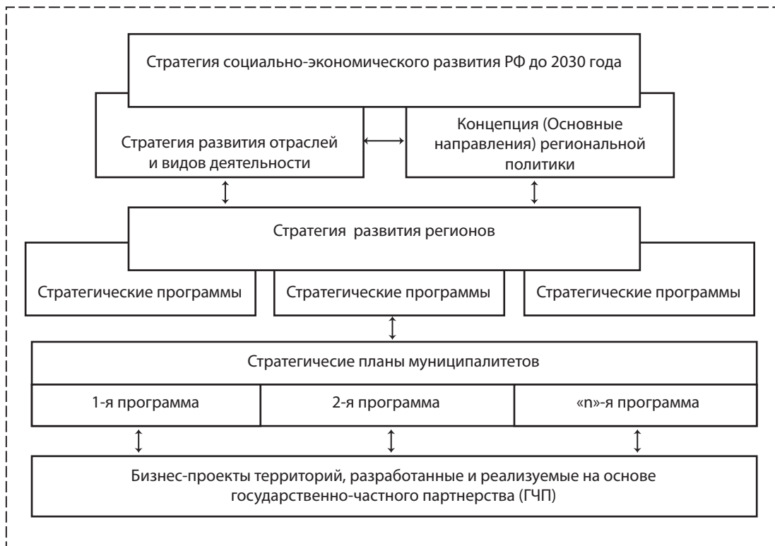
Рис. 2. Логическая цепочка общенационального стратегического управления