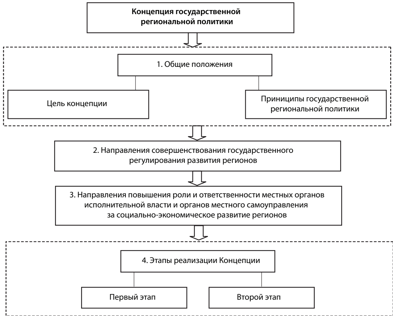
Рис. 2. Содержание Концепции государственной региональной политики

Цель, сформулированная в Концепции [5], – создание условий для динамичного, сбалансированного социально-экономического развития Украины и ее регионов, повышения уровня жизни населения, обеспечения соблюдения гарантированных государством социальных стандартов и т. д. В Концепции сформулированы следующие основные принципы государственной региональной политики: