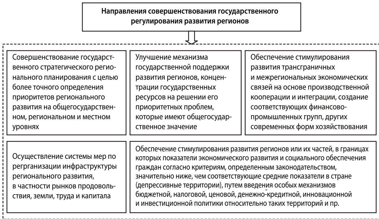
Рис. 3. Направления государственного регулирования развития регионов

рий депрессивными, порядок финансирования и отчетности по стимулированию развития регионов и преодоления депрессивности территорий.