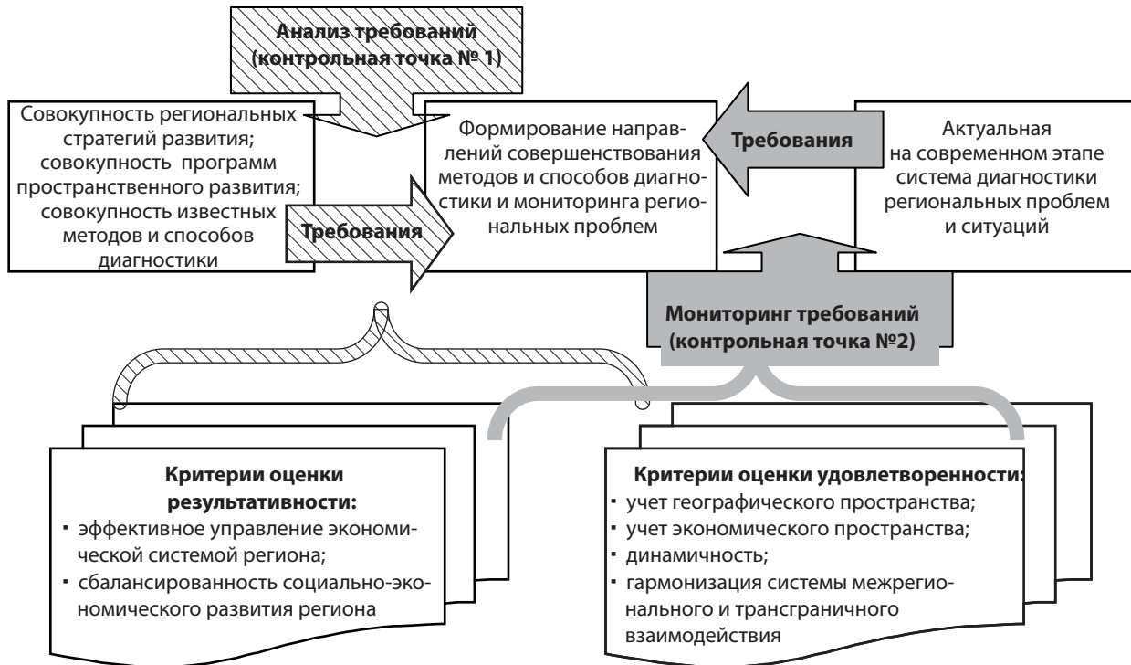
Рис. 3. Мнемоническая модель формирования мультикритериальной системы диагностики региональных проблем и мониторинга ситуаций [4]

принимать действия, направленные на улучшение результатов [4].