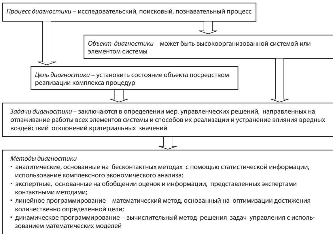
Рис. 1. Характеристика экономической диагностики как процесса [22]

регионального анализа и статистической информации), экспертную (применение контактных методов проведением специальных экспертных и социологических опросов) и диагностику на моделях («модельную» диагностику). Наконец, классификацию видов экономической диагностики в антикризисном управлении предлагает Е. Тренков (рис. 2) [22].