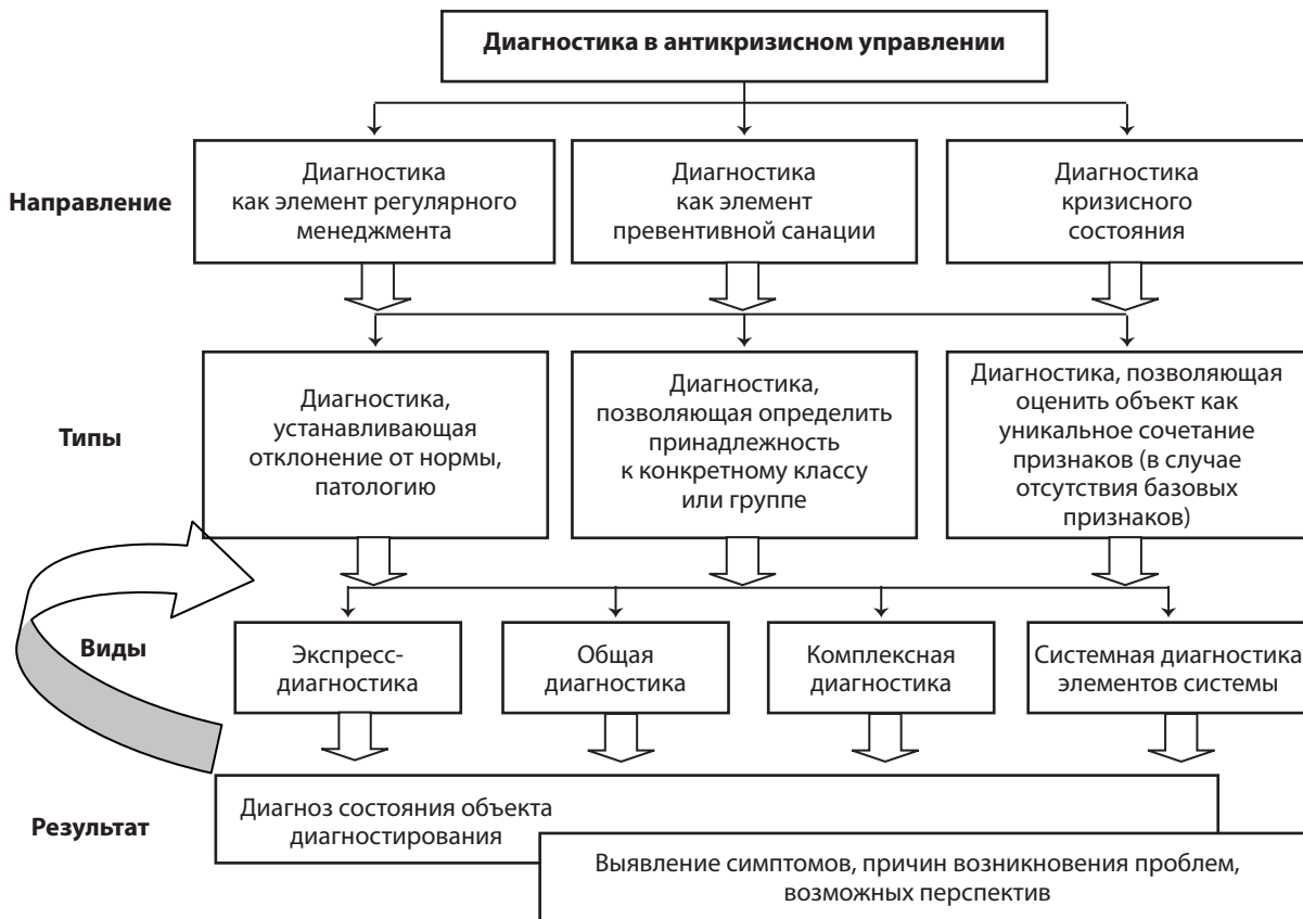
Рис. 2. Классификация типов и видов диагностики

регионы устойчивого развития, стагнирующие, пионерные, или нового освоения, кризисные, регионы с чрезвычайной ситуацией [25].